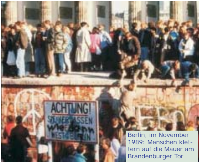
Berlin, im November 1989: Menschen klettern auf die Mauer am Brandenburger Tor