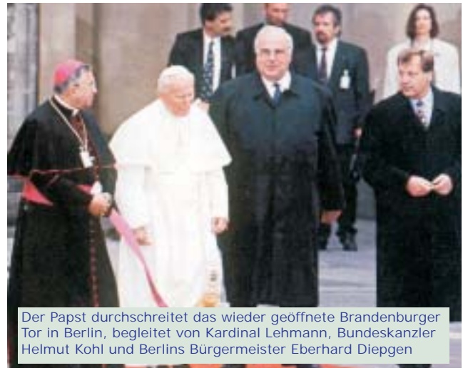
Der Papst durchschreitet das wieder geöffnete Brandenburger Tor in Berlin, begleitet von Kardinal Lehmann, Bundeskanzler Helmut Kohl und Berlins Bürgermeister Eberhard Diepgen