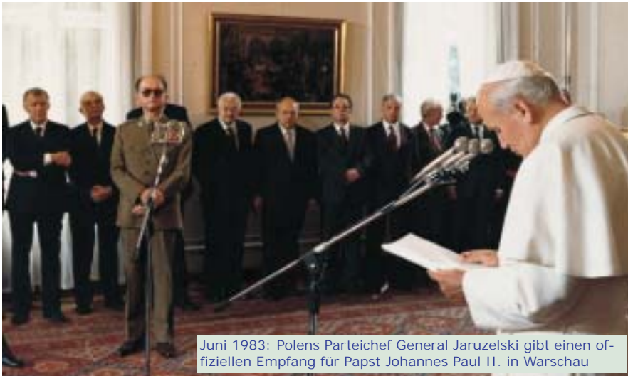
Juni 1983: Polens Parteichef General Jaruzelski gibt einen offiziellen Empfang für Papst Johannes Paul II. in Warschau