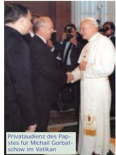
Privataudienz des Papstes für Michail Gorbatschow im Vatikan